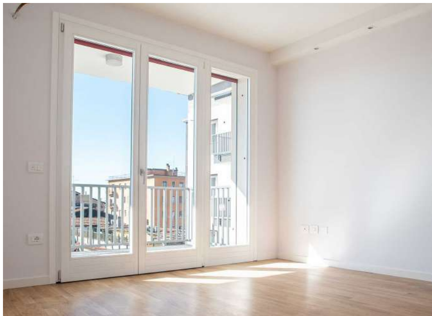
Serramento due ante apribili ed una parte fissa

I serramenti esterni saranno in legno di pino lamellare giuntato, laccato bianco, dello spessore finito di mm 78 X 90 completi di ferramenta, 3 guarnizioni e maniglie cromo-satinate; Per avere il miglior isolamento termico ed acustico saranno costituiti da doppia vetrocamera, separata da pellicola basso emissivo e contenente gas; Tutti saranno forniti di anta a ribalta e sistema di microventilazione.