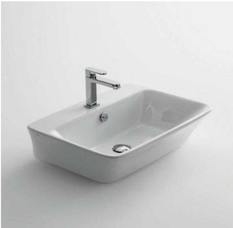
Lavabo Cow 60

Nel bagno piano primo verranno installati sanitari in ceramica, marca Art Ceram , e precisamente :