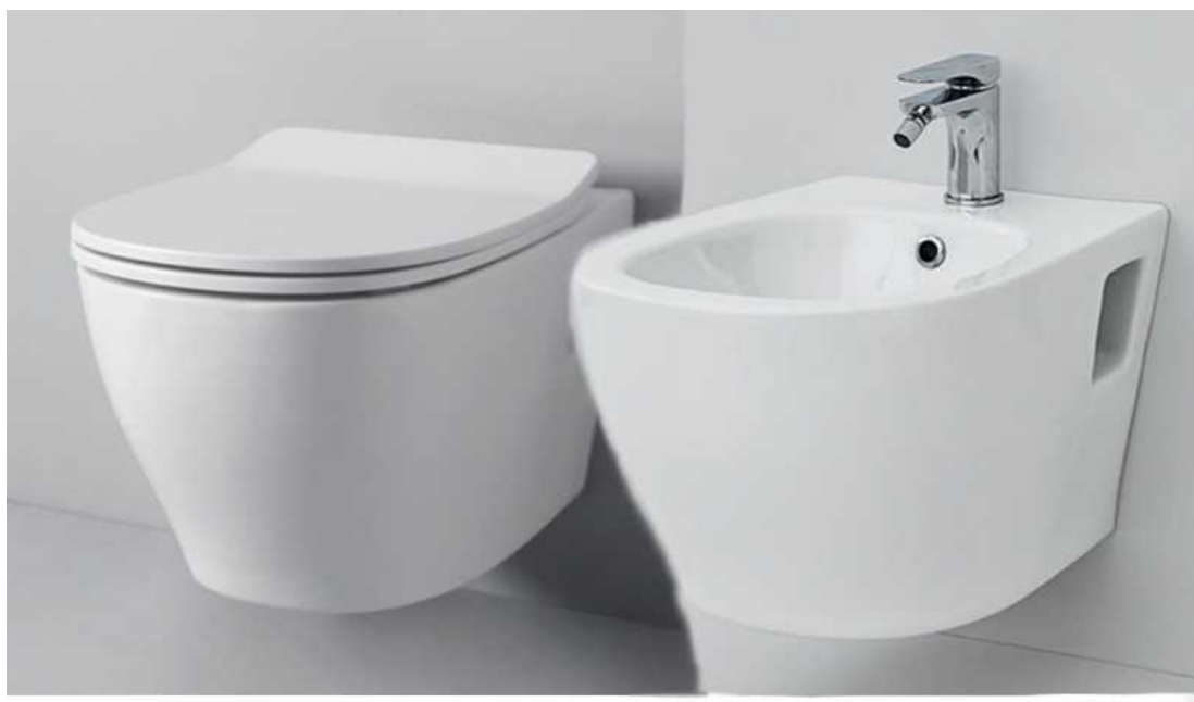
Sanitari Ten Sospesi

I miscelatori saranno di marca Grohe modello Eurodisc.