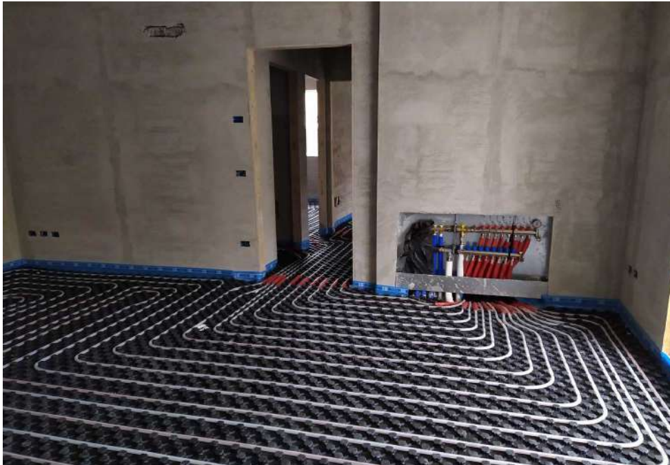
Riscaldamento a pavimento completo

L' impianto di riscaldamento sarà autonomo per ogni singola unità immobiliare, del tipo a pavimento radiante con termoregolazione elettronica controllata da termostato. Sarà installato un sistema compatto, privo di alimentazione a gas e costituito da un armadio tecnico e da una pompa di calore idronica per la produzione di acqua calda sanitaria e tecnica per il riscaldamento a pavimento e raffrescamento tramite split a parete.