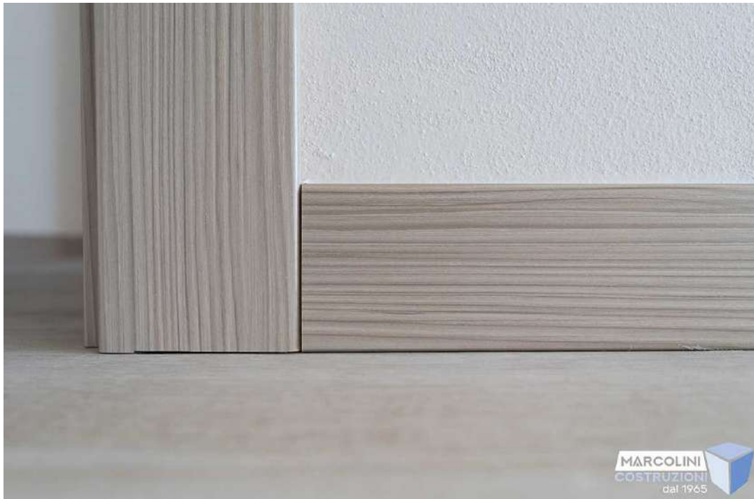
Pavimentazione e battiscopa

Tutti i locali verranno rifiniti con intonaco del tipo civile e tinteggiati con pittura semilavabile di colore bianco.