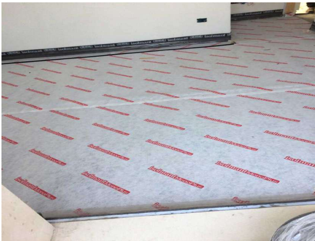
Tappeto acustico e fascia perimetrale prima della posa del riscaldamento a pavimento